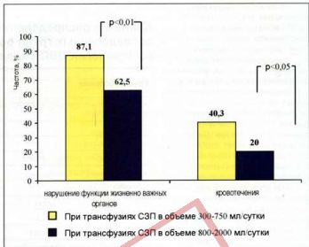
Рис. 4. Частота основных клинических проявлений у больных с ДВС-синдромом, получавших различные дозы СЗП

Приведенные выше данные свидетельствуют в пользу того, что у больных с ДВС в начальной клинической стадии его развития степень снижения активности АТ III и концентрации плазминогена, а также повышения D-димера в плазме крови прямо свя-