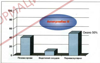
Рис. 9. Распределение анти тромбина III в крови и тканях [73] Примечание: * – по мнению авторов статьи, данный факт заслуживает особого внимания и должен стать предметом исследований

Рассматривая противосвертывающий потенциал плазмы крови, нельзя обойти и вторую по значимости физиологическую антикоагулянтную систему – систему протеина С, все компоненты которой в полной мере присутствуют в криоплазме. Данный механизм ограничения фибринообразования включает в себя протеин С, его кофактор – протеин S, тромбомодулин (мембранный белок, вырабатываемый эндотелиоцитами кровеносных сосудов) и рецептор протеина С на эндотелиальных клетках. Протеины С и S – витамин-К-зависимые белки плазмы, синтезирующиеся в клетках печени. Известно, что активированный протеин С (АПС) в присутствии протеина S способен блокировать и лизировать факторы Va и VIII, расположенные на мембране активированных тромбоцитов, а также ингибитор тканевого активатора плазминогена (PAI-1). Нейтрализация последнего приводит к усилению фибринолитических реакций, что увеличивает противотромботические воздействия. Основная активация протеина С происходит на поверхности эндотелиальных клеток, где он связывается со своим рецептором и взаимодействует с комплексом тромбин-тромбомодулин. Это уникальный механизм нейтрализации тромбина, поскольку результатом реакции является активация протеина С (АПС), а тромбин, входящий в указанный комплекс, необратимо теряет способность к превращению фибриногена в фибрин [12; 29].