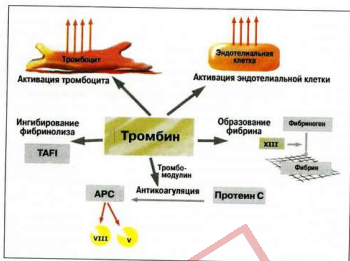
Рис. 2. Мишени для тромбина [68]. TAFI – активируемый тромбином ингибитор фибринолиза