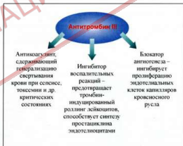
Рис. 5. Роль антитромбина III в защитных реакциях организма

Применение препарата АТ III представляется логически и патогенетически обоснованным при его изоли-