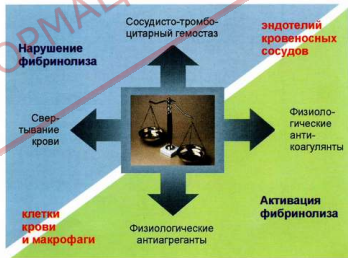
Рис. 1. Динамическое равновесие гемостатических реакций в условиях физиологической нормы

В системе гемокоагуляции действуют силы как самоускорения, так и самоторможения, в связи с чем процессы локального свертывания крови и тромбирования сосудов, как правило, ограничиваются местами поврежденных сосудов и близлежащих тканей. И лишь при сверхпороговой, интенсивной активации этой системы и генерации в крови большого количества тромбина эти ограничительные механизмы становятся недостаточными, что ведет к развитию синдрома диссеминированного свертывания крови (ДВС), а при неправильном или запоздалом лечении часто заканчивается гибелью больного [9, 16].