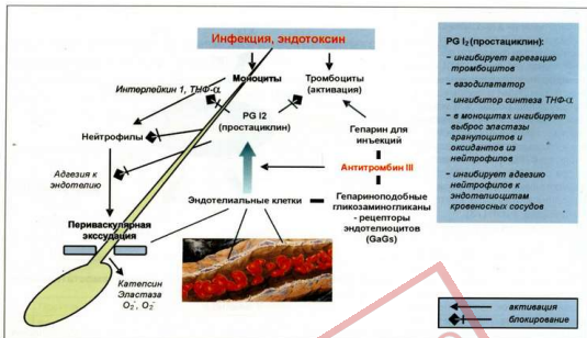
Рис. 8. Анти тромбин III предупреждает активацию лейкоцит-опосредованного повреждения кровеносных сосудов легких посредством стимуляции синтеза и экспрессии сосудистой стенкой простаглицлина (PG I 2 ) [73]. Схема кровеносного сосуда приведена по H.Schmid-Schonbein, G.Grunau, H.Brauer. Exempla Haemorrhologica , 1978

Рассматривая противосвертывающий потенциал плазмы крови, нельзя обойти и вторую по значимости физиологическую антикоагулянтную систему – систему протеина С, все компоненты которой в полной мере присутствуют в криоплазме. Данный механизм ограничения фибринообразования включает в себя протеин С, его кофактор – протеин S, тромбомодулин (мембранный белок, вырабатываемый эндотелиоцитами кровеносных сосудов) и рецептор протеина С на эндотелиальных клетках. Протеины С и S – витамин-К-зависимые белки плазмы, синтезирующиеся в клетках печени. Известно, что активированный протеин С (АПС) в присутствии протеина S способен блокировать и лизировать факторы Va и VIII, расположенные на мембране активированных тромбоцитов, а также ингибитор тканевого активатора плазминогена (PAI-1). Нейтрализация последнего приводит к усилению фибринолитических реакций, что увеличивает противотромботические воздействия. Основная активация протеина С происходит на поверхности эндотелиальных клеток, где он связывается со своим рецептором и взаимодействует с комплексом тромбин-тромбомодулин. Это уникальный механизм нейтрализации тромбина, поскольку результатом реакции является активация протеина С (АПС), а тромбин, входящий в указанный комплекс, необратимо теряет способность к превращению фибриногена в фибрин [12; 29].