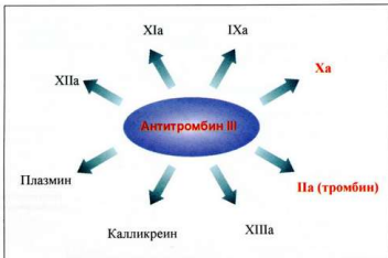
Рис. 6. Мишени антитромбина III при регуляции гемостатических реакций

Возможно, важная и по достоинству не оцененная роль АТ III, особенно в комплексе с низкомолекулярными гепаринами, заключается и в подавлении ангиогенеза в связи с блокированием им пролиферации эндотелиальных клеток капилляров кровеносного русла [79]. Эти функции АТ III еще должны быть осмыслены, тем более учитывая данные о пропорции распределения этого антикоагулянта в крови, эндотелии сосудов и ближайшем периваскулярном пространстве (рис. 9). Мы полагаем, что целесообразность присутствия АТ III за пределами сосудистой зоны определяется физиологическим